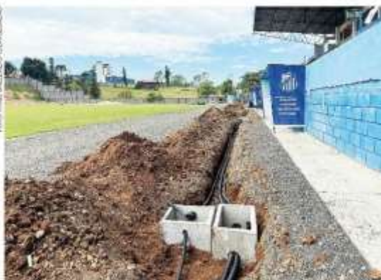
Além da manutenção do gramado, local está recebendo as adequações de iluminação

ILUMINAÇÃO DO GRAMADO E AMPLIAÇÃO DAS CABINES DE IMPRENSA